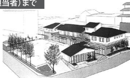
「小規模多機能さきたま(仮称)」