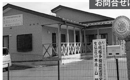
「生協花の木ホーム」