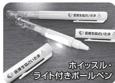
ホイッスル・ライト付きボールペン