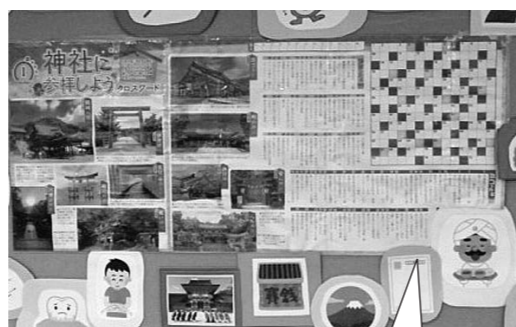
ケアセンター前に提示しているクロスワードパズルです

ご利用者様が好きなことで達成感を得られるよう今後も支援していきたいと考えています。興味がある方は、「通所リハビリテーションくまこ」までお願いします。 (通所リハビリテーションくまこ：坂本)