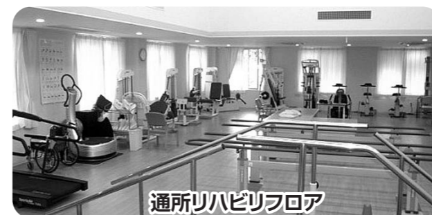
通所リハビリフロア

※歩いたり、走ったりする有酸素運動機器です。傾斜角度や速度で負荷設定を行います。