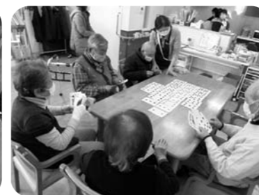
7ならべを行いました。