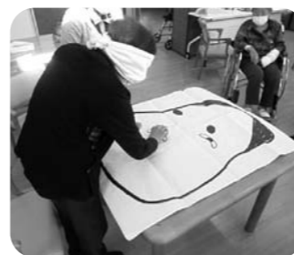
福笑いを行いました。

小規模多機能型居宅介護くまここでは、季節に応じて様々なレクリエーションを行っています。1/26には新年会を実施しました。季節を感じながらゲームや料理を行い、懐かしい気持ちや楽しい気持ちを利用者様同士で共有されていました。