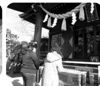
神社へ初詣に行きました。