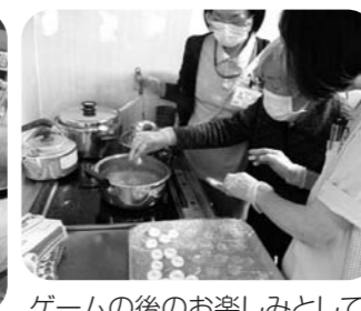
ゲームの後のお楽しみとして おやつにお汁粉を作りました。