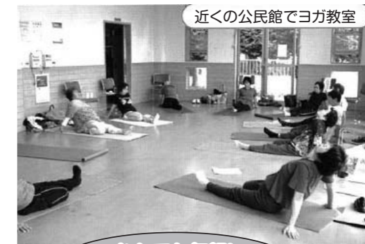
近くの公民館でヨガ教室