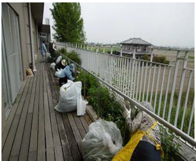
1時間できれいに・・・↑

5/16恒例の2階ルーフトラスの清掃作業が行われました。20人のボランティアさん事業所利用委員さんの協力のもとになすやトマトの苗の植えつけ、草とりでたいへんきれいになりました。午前の作業は「けんこうと平和」の折り込み作業をお願いしました。最後に地域振興「ありがとう券」を渡し終了しました。