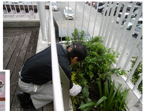
↑年2回草とりをして きれいになっています。