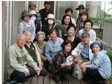
↑ボランティアさん 利用委員さん 全員集合！