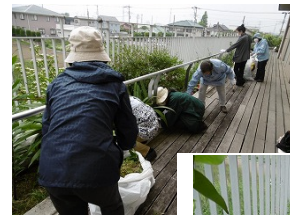
はさみ、シャベル、カマなど揃っています。